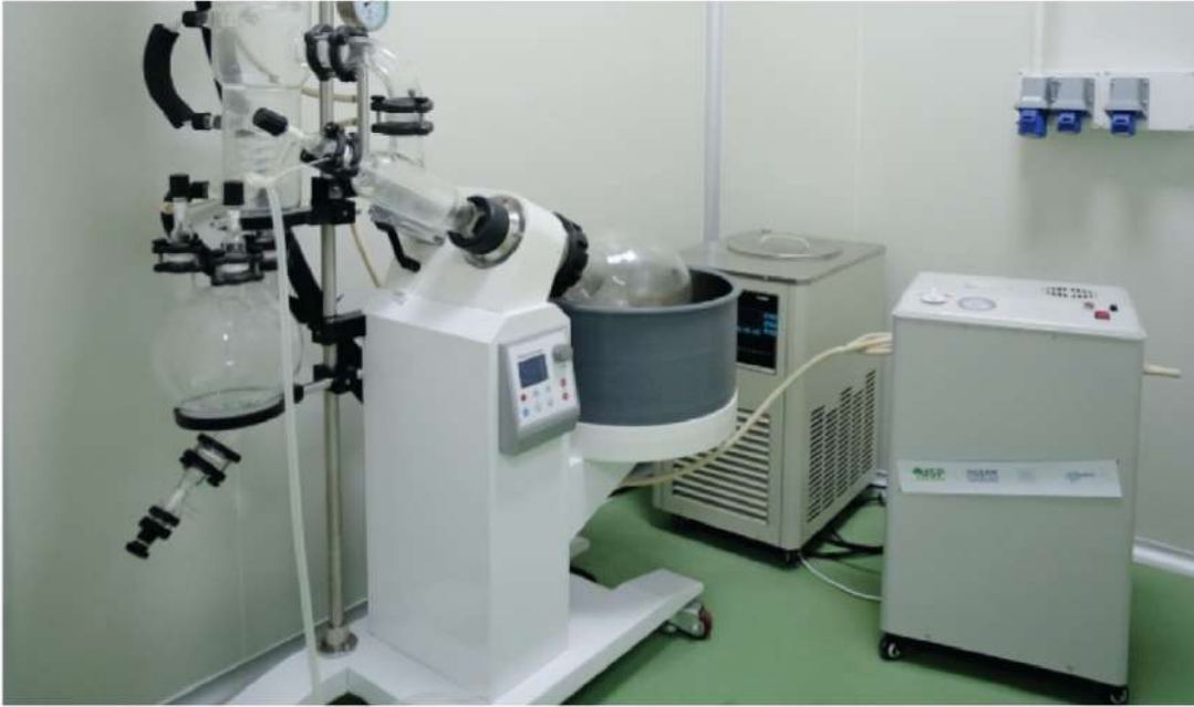
แยกสารสกัดที่ผ่านการ Winterization กับ Ethanol ออกจากกัน

กระบวนการกลั่นระเหยสารแบบหมุน (Rotary Evaporator) จะใช้สำหรับสกัดความเข้มข้น การตกผลึก และการแยก ส่วนของสาร โดยกระบวนการนี้ตัวเครื่องกลั่นระเหยจะแบ่งการทำงานออกเป็น 3 ส่วน คือ 1) ส่วนให้ความร้อนและกลั่นแยกสาร (Rotary Evaporator) 2) ส่วนทำสุญญากาศภายในระบบ 3) ส่วนควบคุมอุณหภูมิภายในระบบ โดยตัวเครื่องจะทำงานภายใต้สภาวะสุญญากาศ ซึ่งมีความร้อนและความเร็วในการหมุนไหลทั่วแบบคงที่ ทำให้สารที่ต้องการระเหยเกิดการระเหยไปยังเครื่องควบแน่น โดยผ่านระบบหล่อเย็นที่จะทำให้สารเกิดการควบแน่นไหลลงสู่ไหลแก้วด้านล่างก็จะได้สารที่ต้องการ